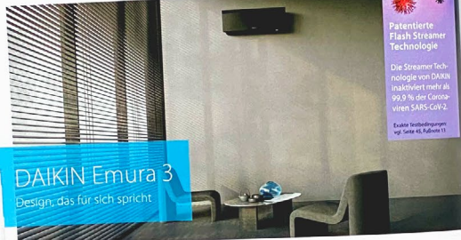
DAIKIN Emura 3 Design, das für sich spricht

Patenterte Flash Streamer Technologie Die Streamer Technologie von DAIKIN inaktiviert mehr als 99,9 % der Coronavirus SARS-CoV-2. Exakte Betriebsdaten von Seite 45, Tabelle 11